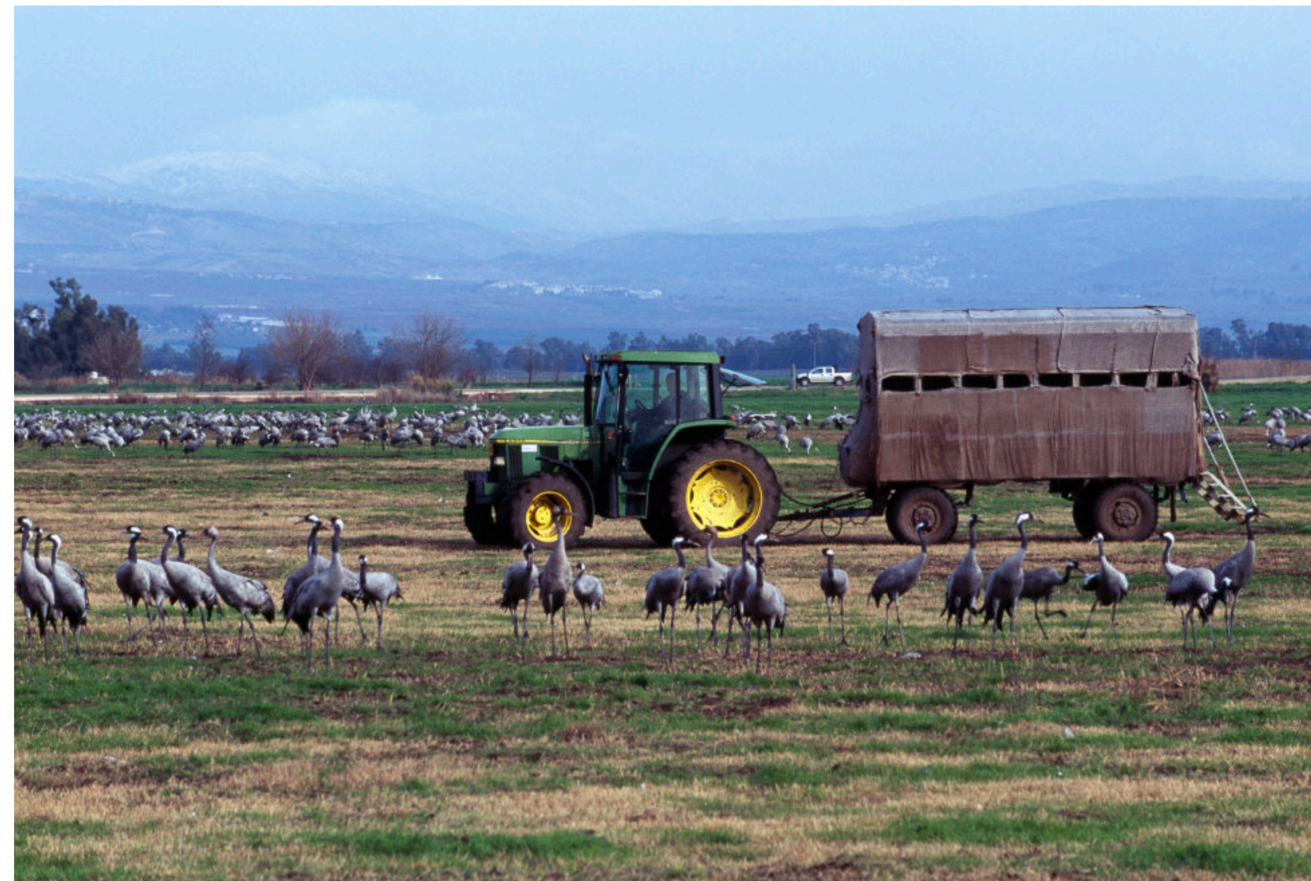
Un fermier déplaçant une cachette pour l'observation des grues européennes, Vallée de Hula, Israël.

C. Les fournisseurs de services indirects. Ces personnes, qui peuvent être les mêmes que les prestataires de services directs, fournissent les repas, le logement, le transport et d'autres services essentiels dont les photographes ont besoin pendant leur séjour.