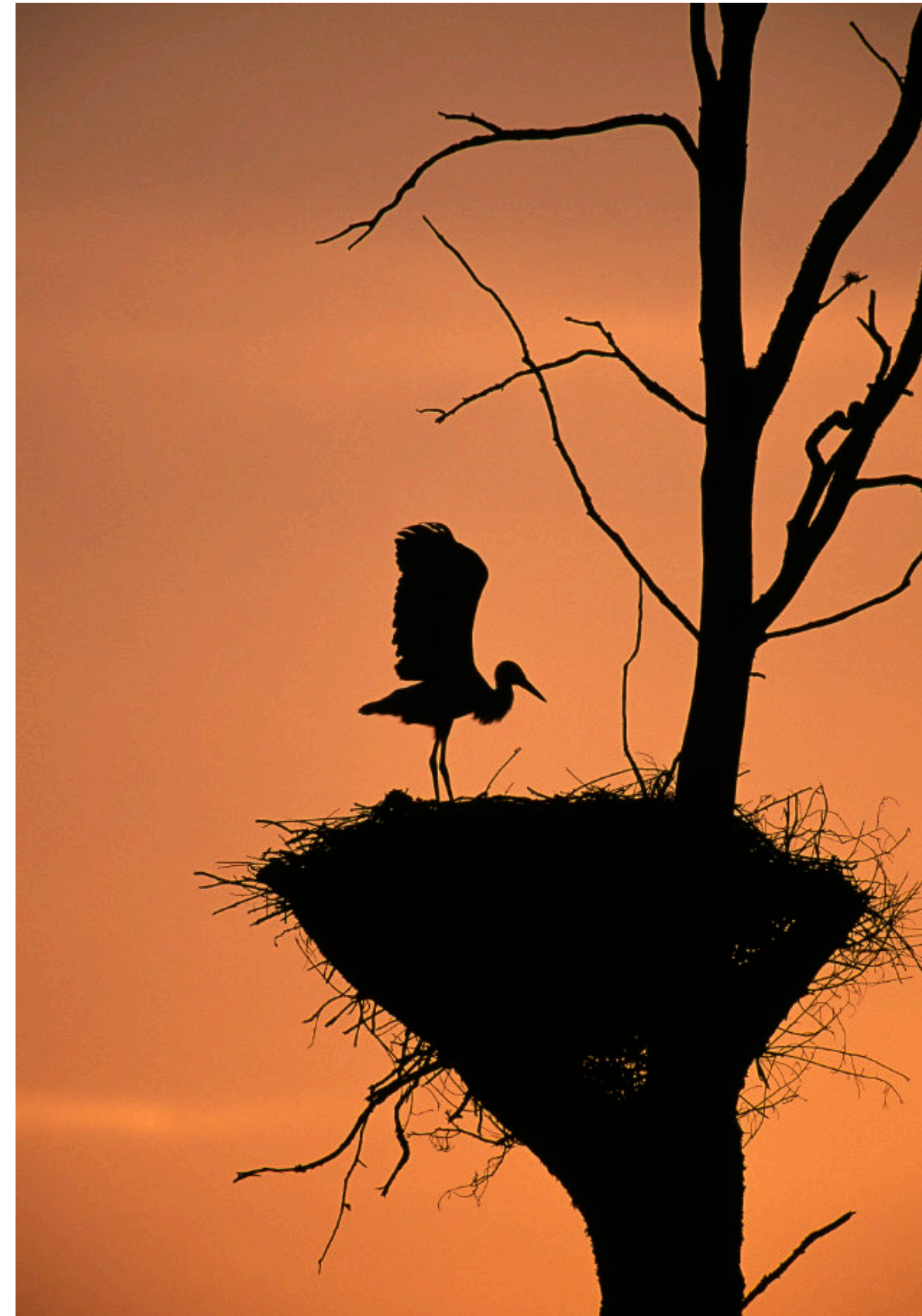
La cigogne blanche, une espèce dont le nombre augmente rapidement dans la Nièvre.