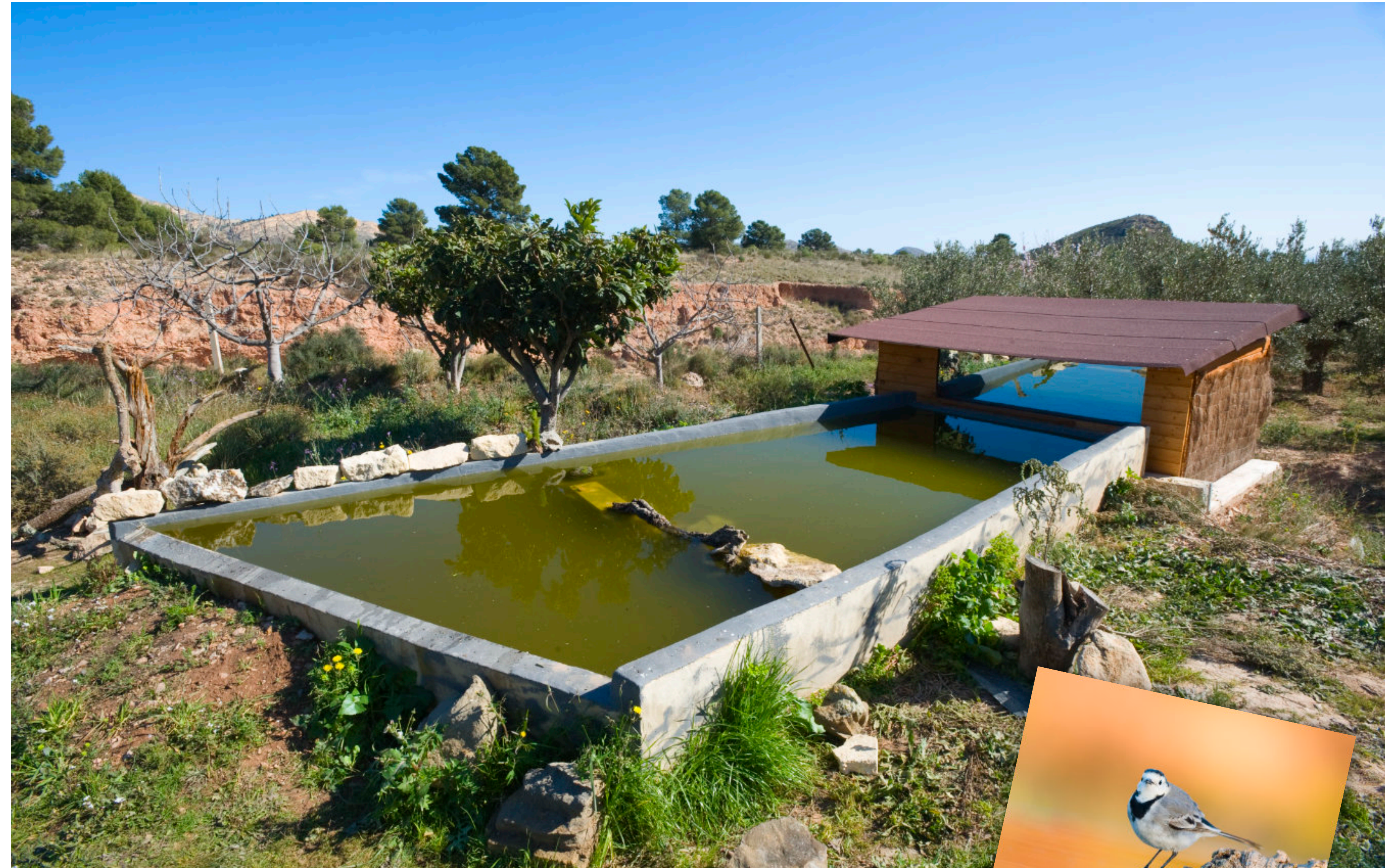
Cachette photographique, Alicante, Espagne.

Le succès d'un grand nombre d'entreprises de photographie animalière, en Hongrie et en Norvège, aux Pays-Bas et en Écosse, en Pologne et en Espagne, repose sur l'offre de possibilités fiables de photographier des espèces intéressantes, ce qui, en dehors de ces lieux, est difficile et prend du temps pour le photographe amateur. Avec des revenus de plus de 150 euros par jour et par personne utilisant un affût photographique, les agriculteurs et les propriétaires terriens qui investissent du temps dans la création et l'entretien de ces possibilités sont bien rémunérés. Et des entreprises comme la nôtre, qui attirent des clients du monde entier, sont désireuses d'utiliser ces sites.