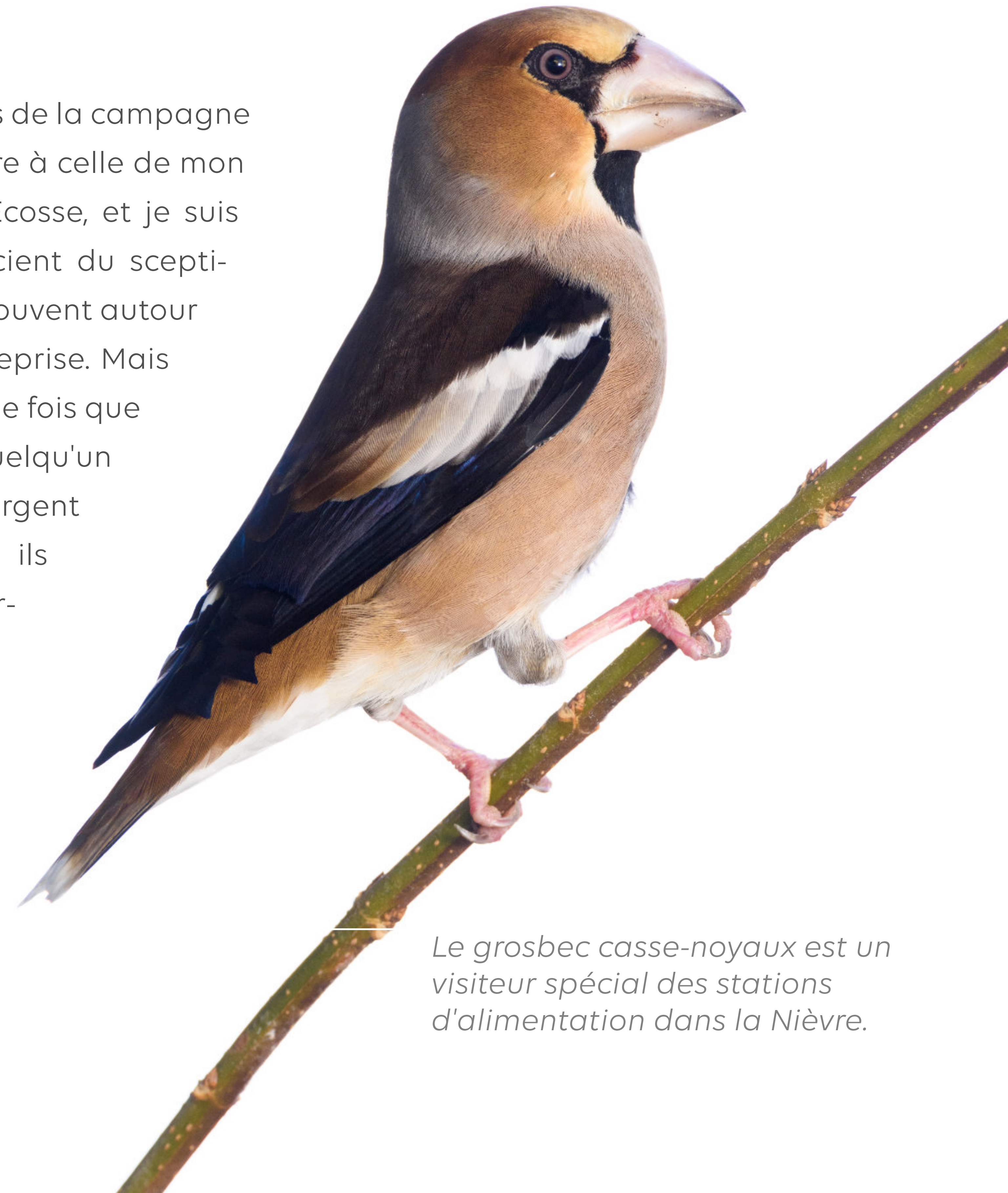
Le grosbec casse-noyaux est un visiteur spécial des stations d'alimentation dans la Nièvre.

La vision des gens de la campagne ici est très similaire à celle de mon pays d'origine, l'Ecosse, et je suis pleinement conscient du scepticisme qui existe souvent autour de ce type d'entreprise. Mais je sais aussi qu'une fois que les gens ont vu quelqu'un gagner de l'argent avec la nature, ils veulent aussi participer à l'action.