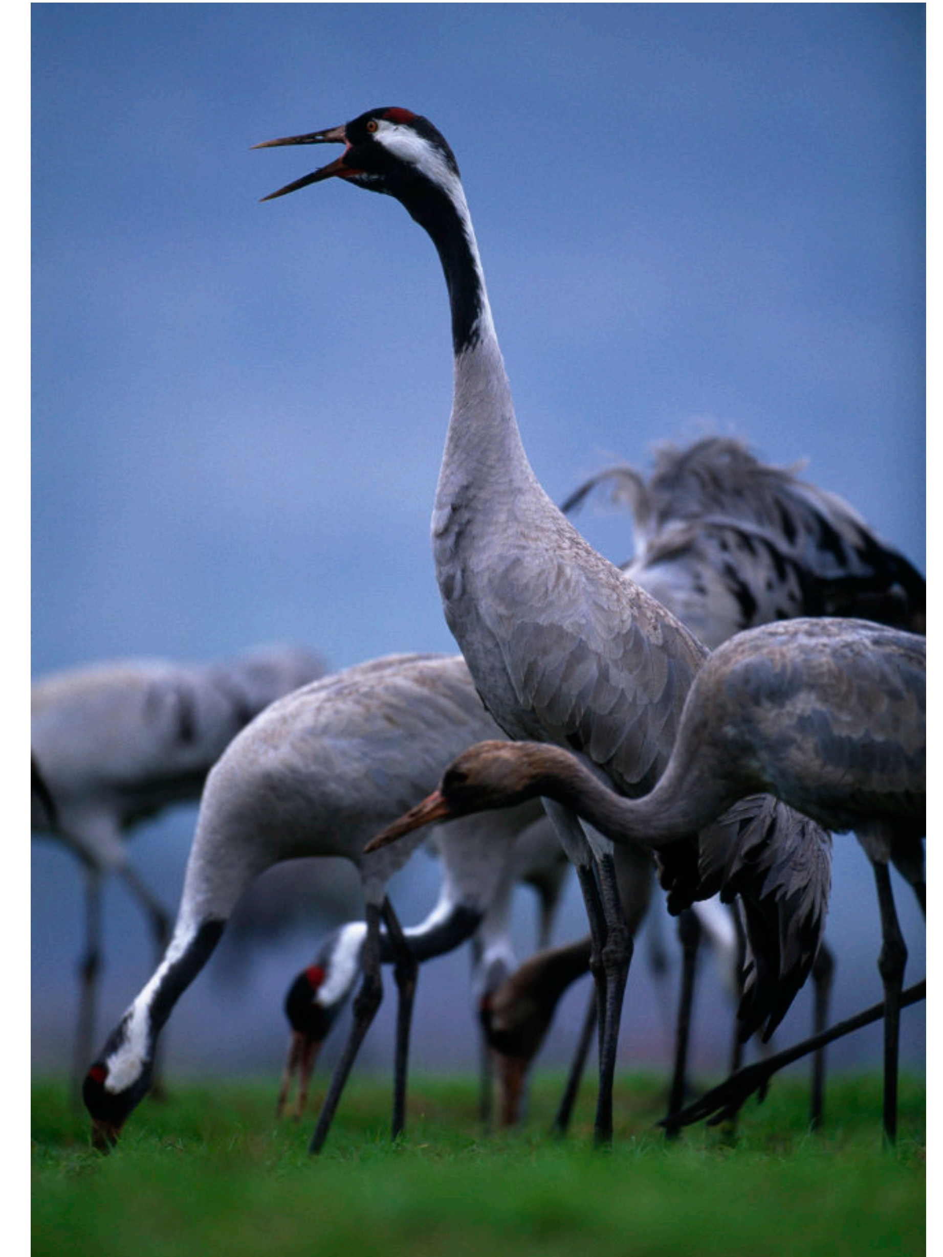
La vallée de la Loire est une halte importante de la migration des grues européennes